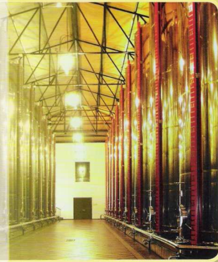
FONDO CÓNICO CON PATAS